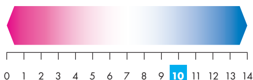
Magas pH-érték, lúgos kémhatás: aktív védelem penészgombák ellen.

A TecTem® magas pH-értékű (pH=10), a lúgos kémhatás megakadályozza a penészgombák megtelepedését.