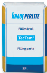
TecTem® Füllmörtel hézagoló