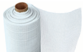
TecTem® Gewebe háló