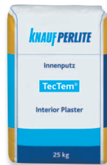
TecTem® Innenputz belső vakolat