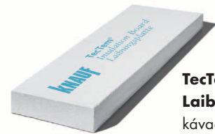
TecTem® Laibungsplatte kávaelem