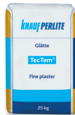
TecTem® Glätte finiselő simító