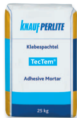
TecTem® Klebespachtel ragasztó