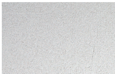
Finoman pórusos belső anyagszerkezet: természetes belső oldali hőszigetelés.

Tökéletes megoldás külső falak természetes és hatásos belső oldali hőszigetelésére.