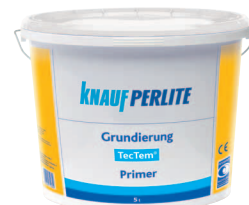
TecTem® Grundierung alapozó