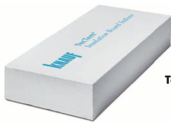
TecTem® Insulation Board Indoor