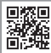
AquaBead Flex Pro